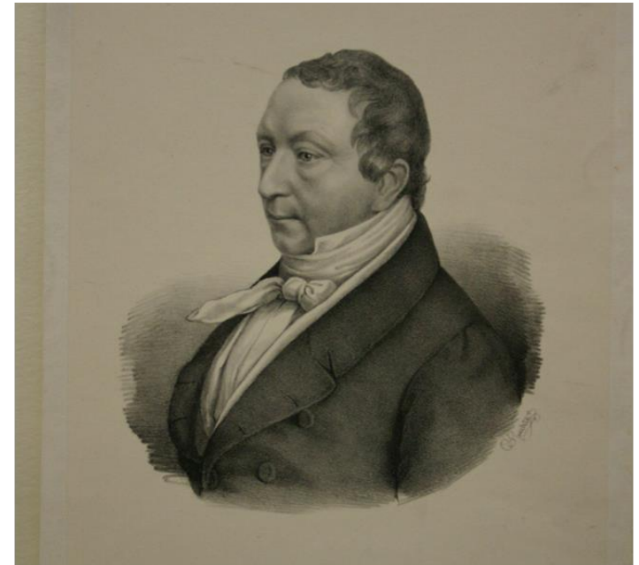
„Hamburgs erster Baudirektor Carl Ludwig Wimmel 1842