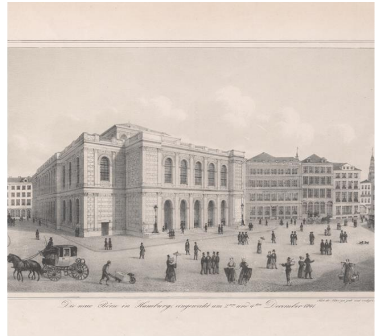
Hamburger Börse entworfen von Carl Ludwig Wimmel, Baujahr 1840